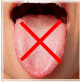
لبها پیدا نیستند