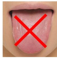
انتهای حلق مشخص نیست