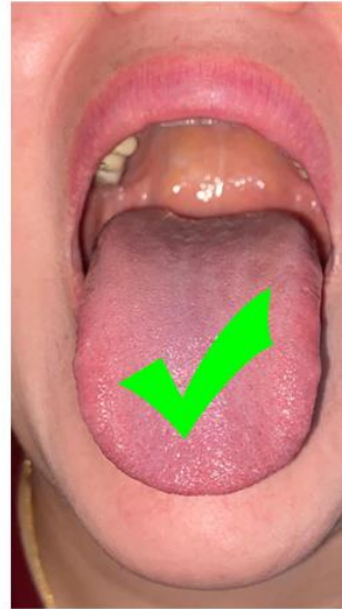
عکس صحیح و خوب